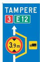
614. Kiertotien suunnistustaulu