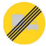
Ohituskielto kuorma-autolla päättyy